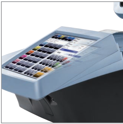
TOUCH SCREEN con inclinazione regolabile