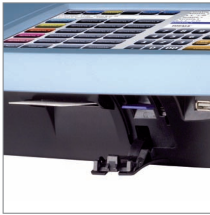
GIORNALE DI FONDO ELETTRONICO, USB MASTER E LETTORE CHIP CARD INTEGRATO